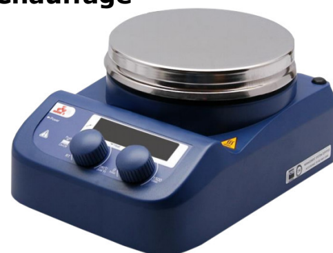
Cod. ES-AG3MR - Version avec plaque de travail en Acier Inoxydable