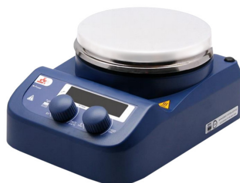
Cod. ES-AG3MRC - Version avec plaque de travail en Céramique