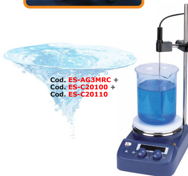
Cod. ES-AG3MRC + Cod. ES-C20100 + Cod. ES-C20110